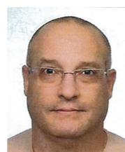
Jorge Esteves APA / Prosegur Lisboa